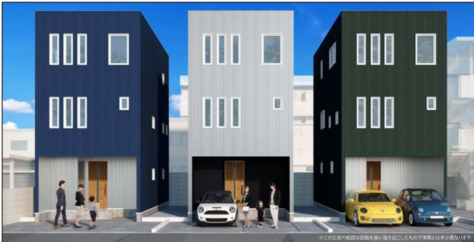
※この広告の絵画は図面に描き起こしたもので実際とは多少異なります。